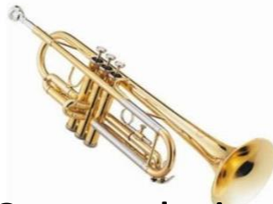
Orquesta de vientos